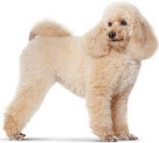
気品のある被毛 プードル