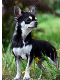
最も小さい犬種 チワワ