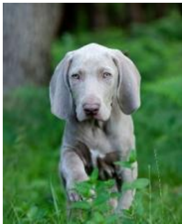
グレーの短毛が特長 ワイマラナー