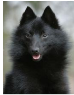
キツネ顔が特長 スキッパーキ