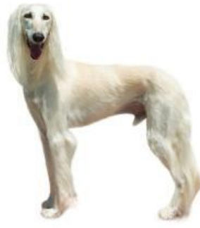
最も古い犬種の一つ サルーキ