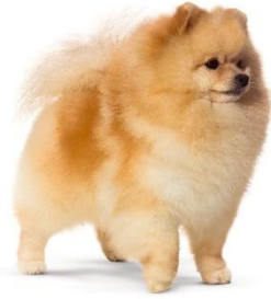
フワフワで多様な毛色 ポメラニアン