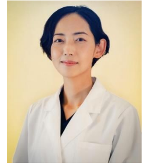
横浜動物医療センター