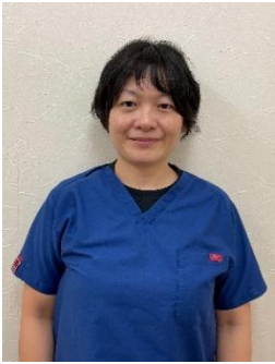
聖母坂どうぶつ病院