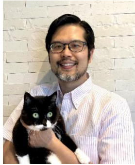
くわはら動物病院