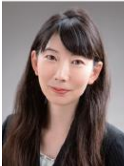
ロイヤルカナナ ジャパン