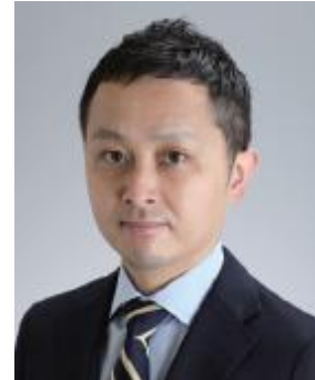
ロイヤルカナナ ジャパン