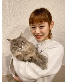
イラストレーター