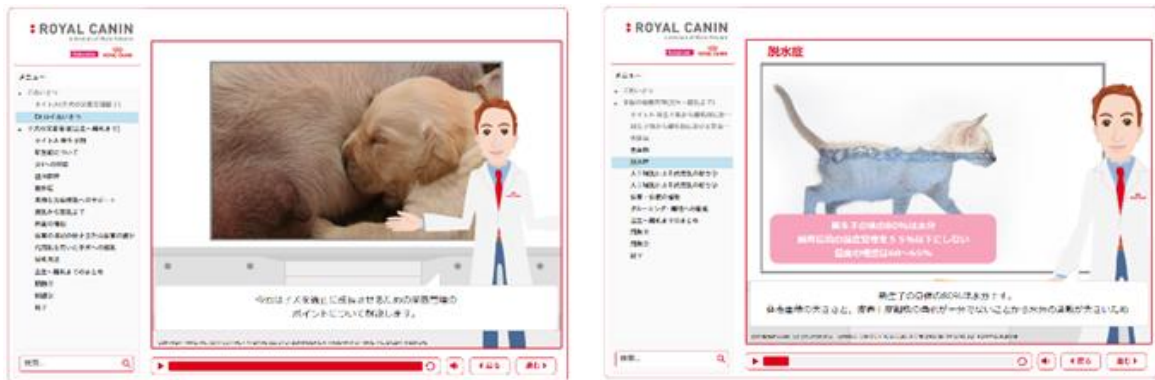
<Dr.ロイと学ぶ！e-ラーニングコンテンツの様子>

さらに、「Dr.ロイと学ぶ！e-ラーニングコンテンツ」では、子犬・子猫の栄養管理、ライフステージ、尿石症に配慮した食事管理について、キャラクターとの会話やクイズを通して、獣医師及び動物看護師にとって必要な情報を気軽に学んでいただけるコンテンツを用意し、多くの参加者にご視聴いただきました。