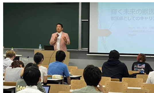
＜北里大学 十和田キャンパスでの開催の様子＞

オンライン開催は「女性獣医師の働きかたを考える」(6月)、「タイプの異なる動物病院を徹底解剖！」(9月)、「若手先輩獣医師から学ぶ」(11月)と各回テーマを変えて3回開催し、延べ約80名の学生が参加しました。先輩獣医師からの講演はもちろん、獣医学生が実際に獣医療の現場へ潜入取材した動画を通じ、現場を見て感じたこと、学んだことなども紹介、共有いただきました。