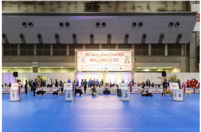
<昨年(2023年)開催時の様子>