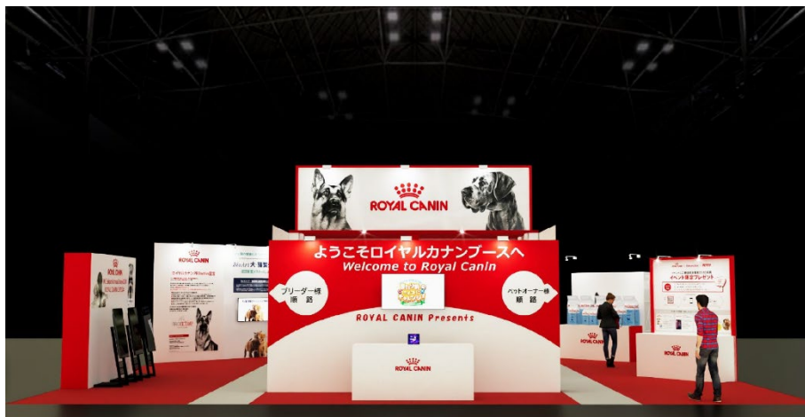
<ロイヤルカナンブース>※イメージです

またブリーダーやシェルターなど専門家の方向けにはポータル・コミュニティサイト「ロイヤルカナン PRO CLUB」をはじめ、ロイヤルカナンが提供している各種サービスを体験いただけるほか、犬・猫繁殖士認定者を講師に迎え繁殖ワンポイントレッスン(相談会)を開催するなど、専門家の皆さまのビジネスが持続的に発展できるよう支援します。