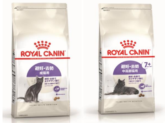
「FHN ステアライズド」 「FHN ステアライズド 7+」 2021年3月26日(金) メーカー出荷開始

栄養学に基づいた犬と猫のプレミアムペットフードおよび食事療法食を展開するロイヤルカナン ジャポン(本社:東京都港区、社長:山本 俊之)は、避妊・去勢した猫に適した栄養をバランスよく配合し、健康をサポートするための総合栄養食「フィーライン ヘルスニュートリション(FHN) ステアライズド」および「FHN ステアライズド 7+」の販売を開始しました。「FHN ステアライズド」は12ヶ月齢～7歳の成猫用、「FHN ステアライズド 7+」は7歳以上の中高齢猫用と、年齢に合わせて選択できます。