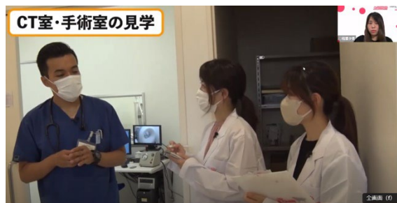
「職場を知る～各職場を疑似体験!密着動画+体験者インタビュー～」における獣医学生による現場潜入取材の様子