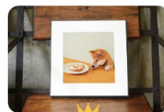
フォトパネルギフト券 抽選で10名様

名称 : 7歳からの健康チェックキャンペーン 2023 登録期間: 受付中~2023年12月22日(金) 特設サイト: https://www.v.royalcanin.co.jp/cp/7hc/2023/ 賞品 : オリジナルフォトパネルギフト券(抽選で10名様) 健康チェック証明書(参加者全員)