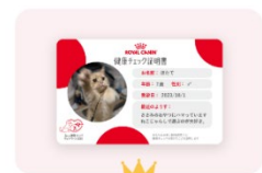
健康チェック証明書(データ) 参加者全員

お気に入りの写真でオリジナルフォトパネルが作れる、FUJIFILMウォールデコギャラリーリータイプ 275mm×275mm (定価7,260円)のギフト券をプレゼントいたします。